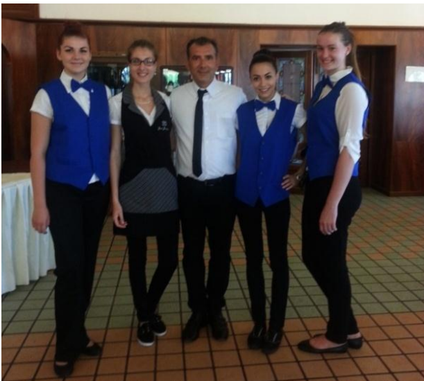
Obsluha v Villaggio Baia Samuele na Sicílii

✿ Čašník – žiak pracuje v čase prípravy a podávania raňajok, obedov a večerí, jeho náplň práce spočíva v prestieraní reštaurácie, obsluhu hostí v reštaurácii a príprave reštaurácie na ďalšiu prevádzku.